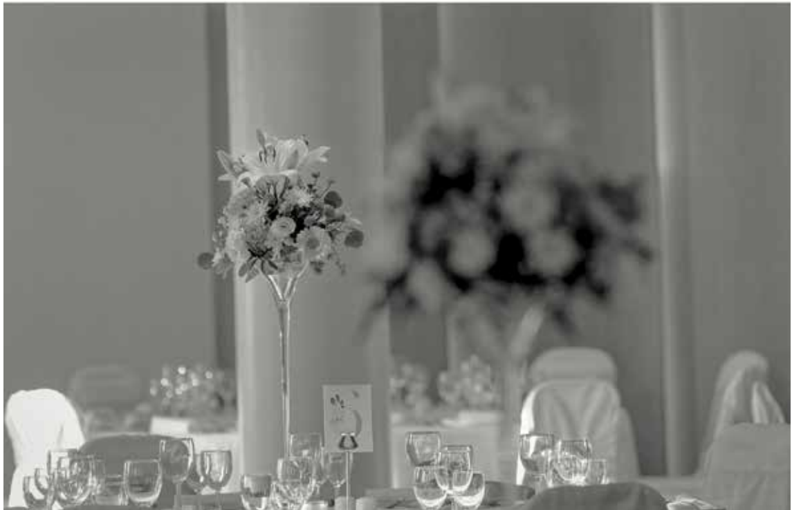
Pestana Grand