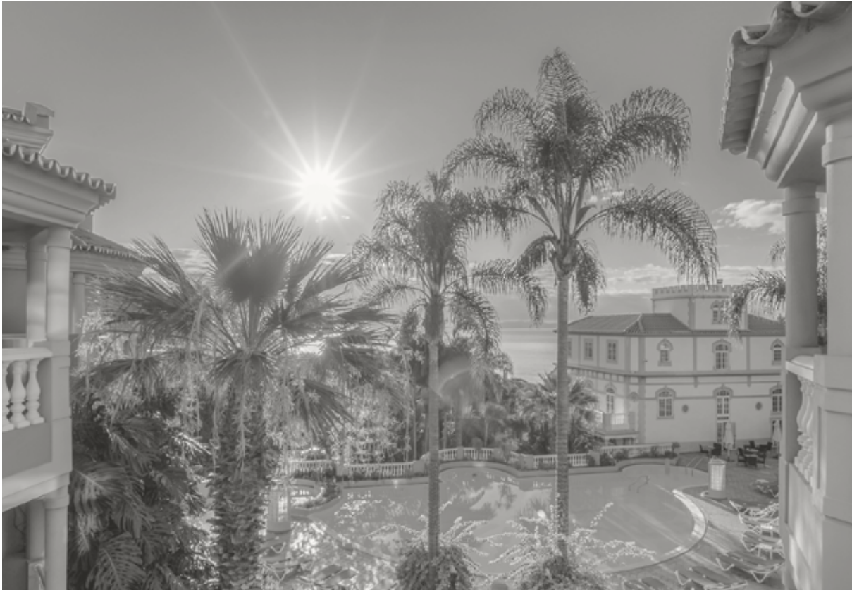
Pestana Village&Miramar Garden & Ocean Hotel ****