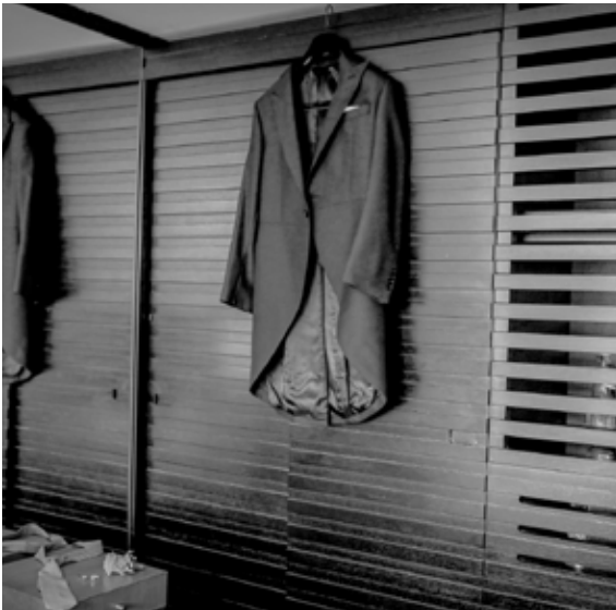
Fotógrafo parceiro / partner photographer