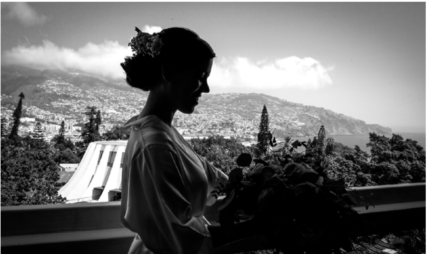
Fotógrafo parceiro / partner photographer