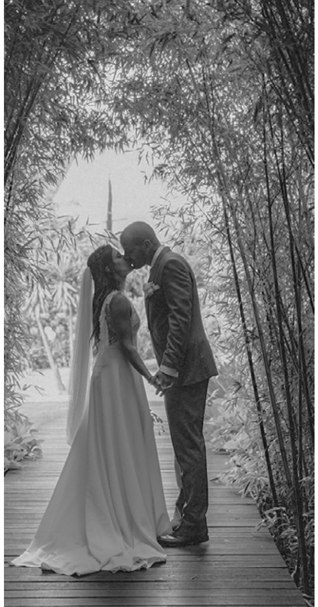
Pestana Casino Park