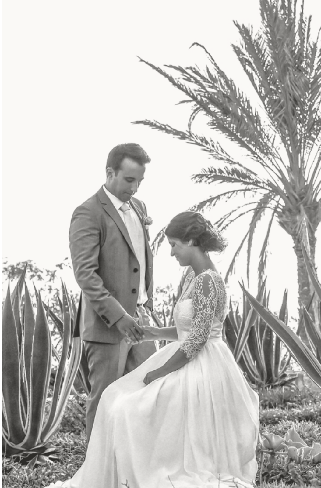
Pestana Grand