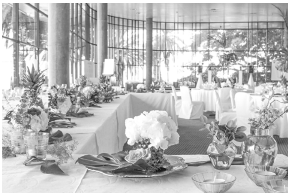
Parceiro / Partner Tulipa