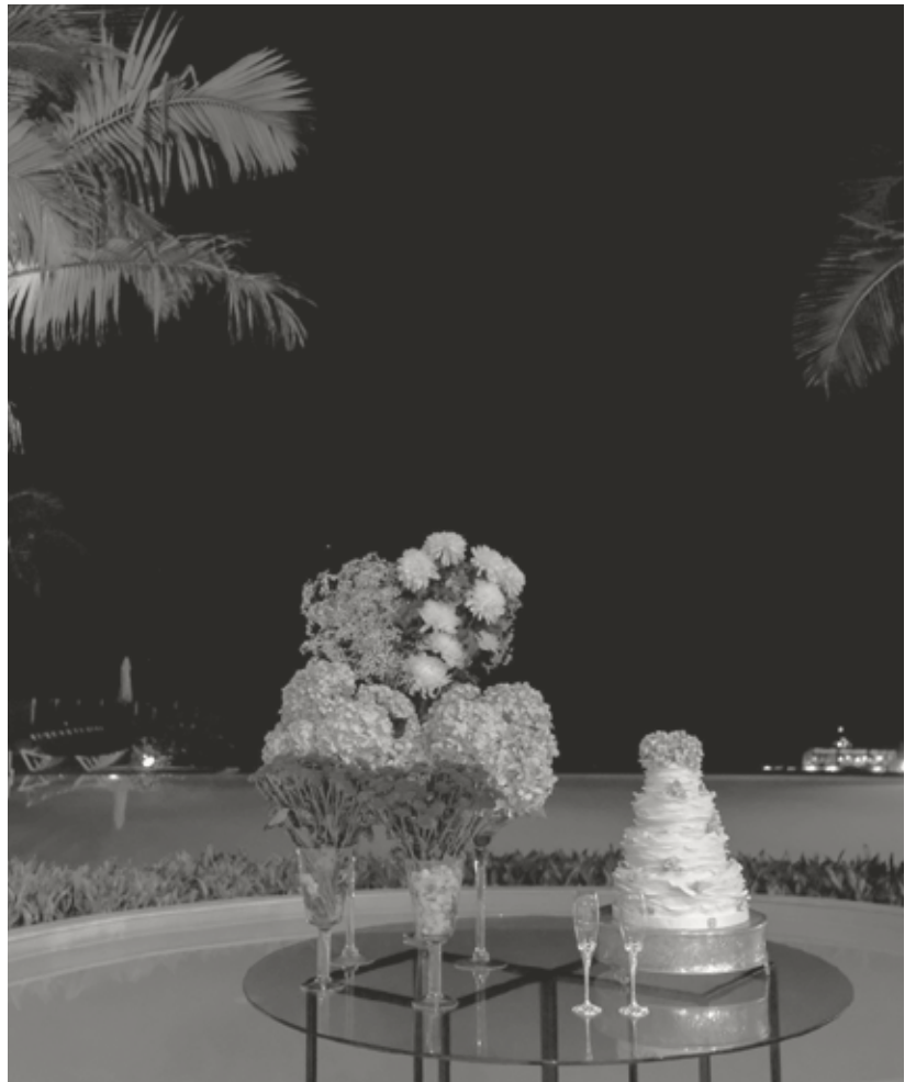
Pestana Casino Park