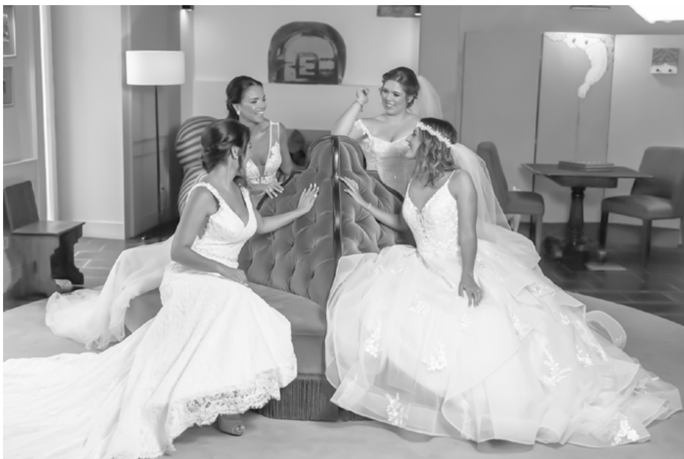
Cabeleireiro parceiro / Partner hairdresser By Jessy