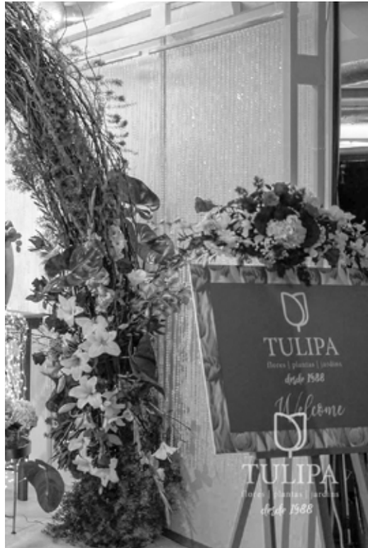
Parceiro / Partner Tulipa