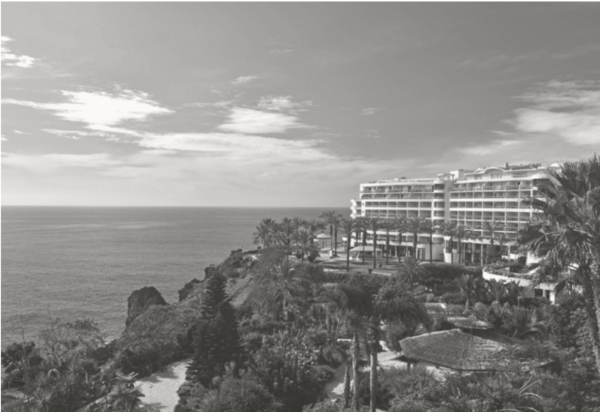
Pestana Grand Premium Ocean Resort *****