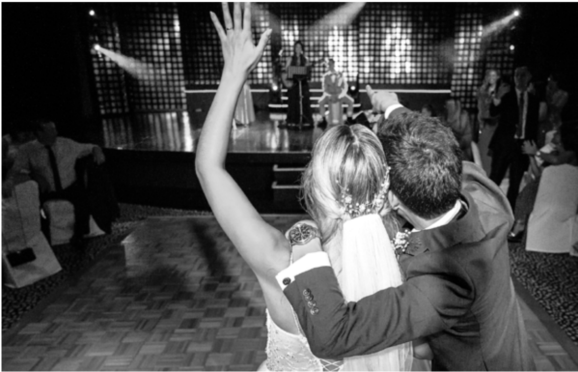
Pestana Casino Madeira