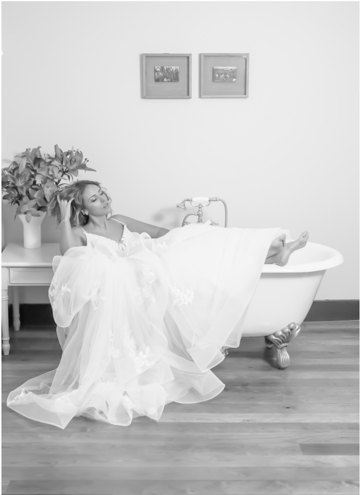
Cabeleireiro parceiro / Partner hairdresser By Jessy