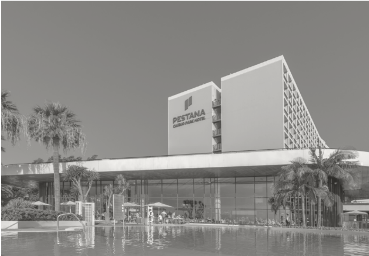
Pestana Casino Park Ocean & Spa Hotel *****