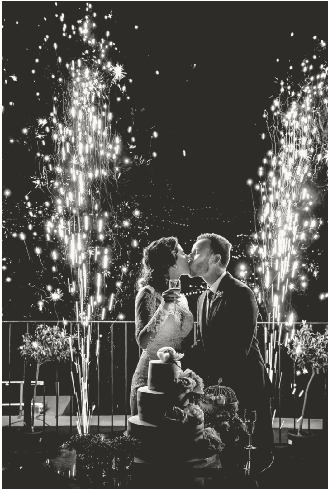
Pestana Casino Madeira