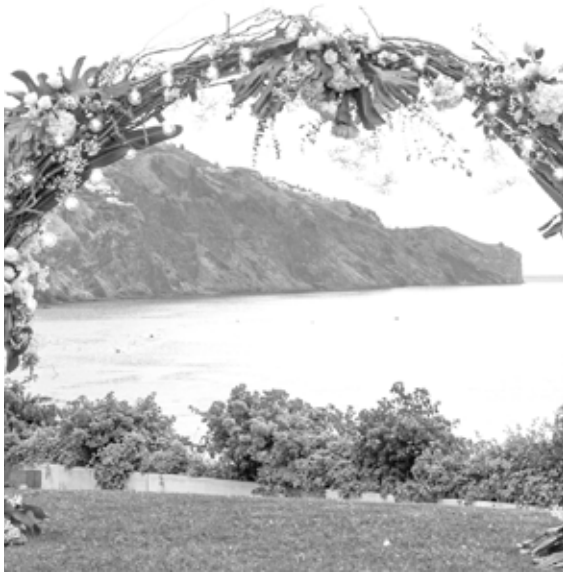
Parceiro / Partner Tulipa