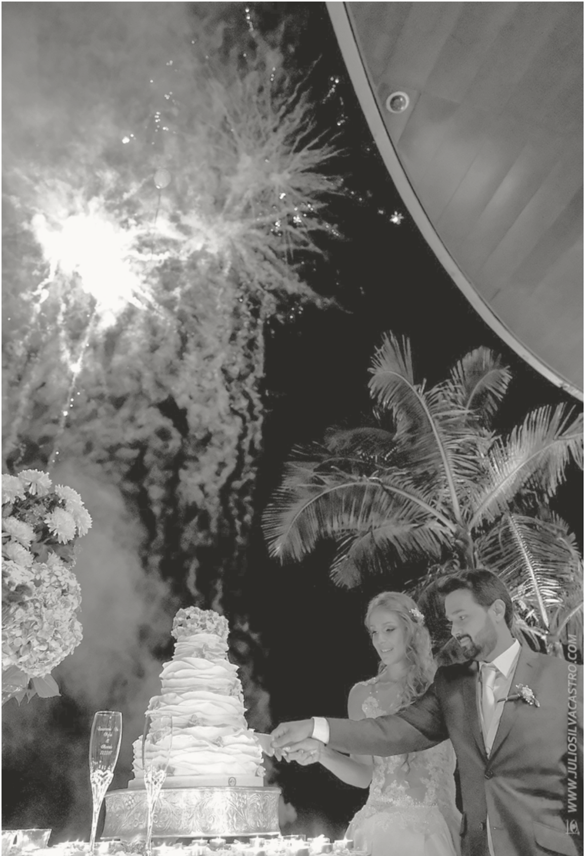
Pestana Casino Park