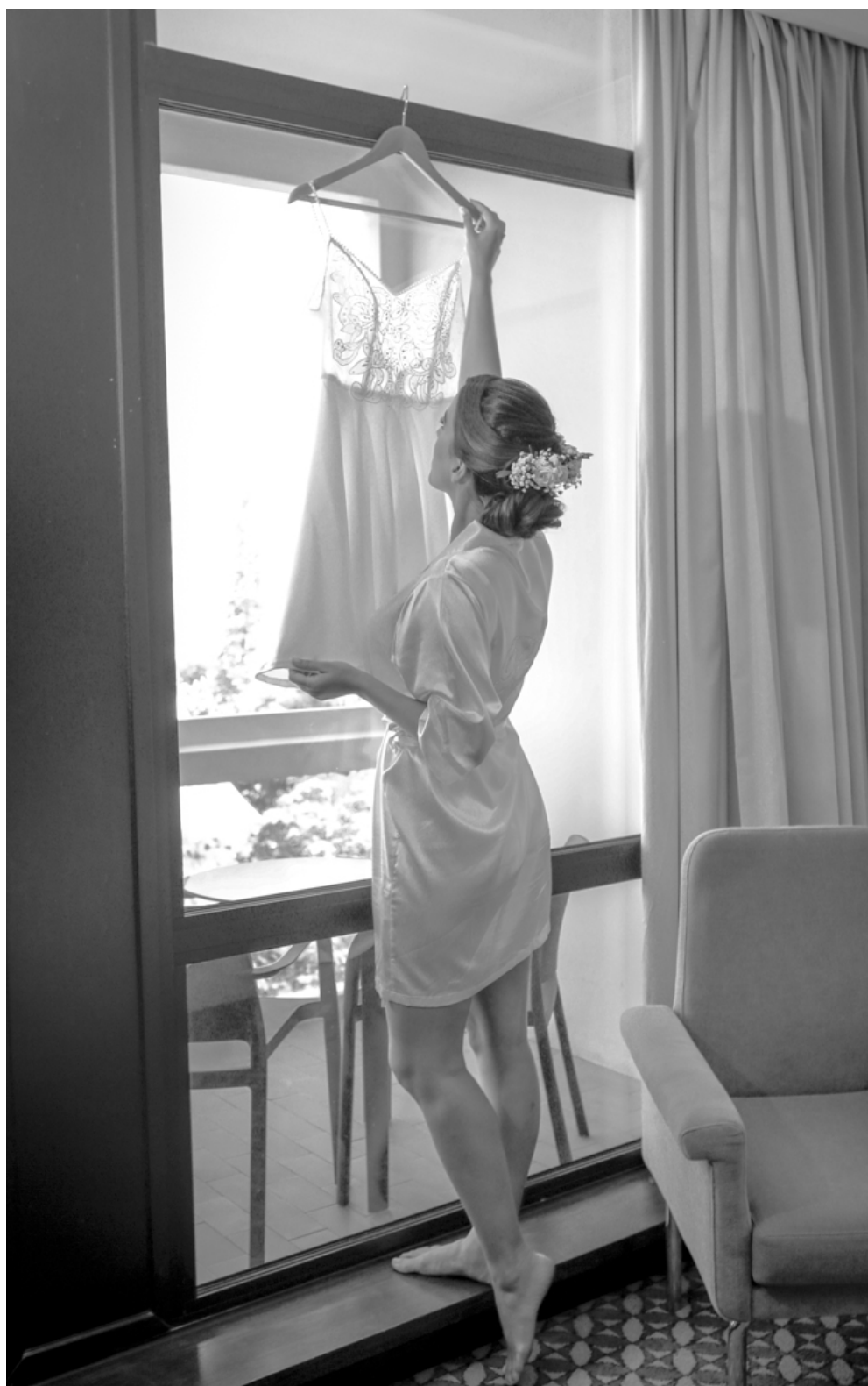
Fotógrafo parceiro / partner photographer