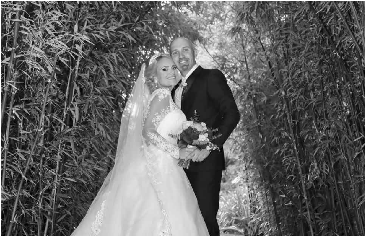
Fotógrafo parceiro / partner photographer