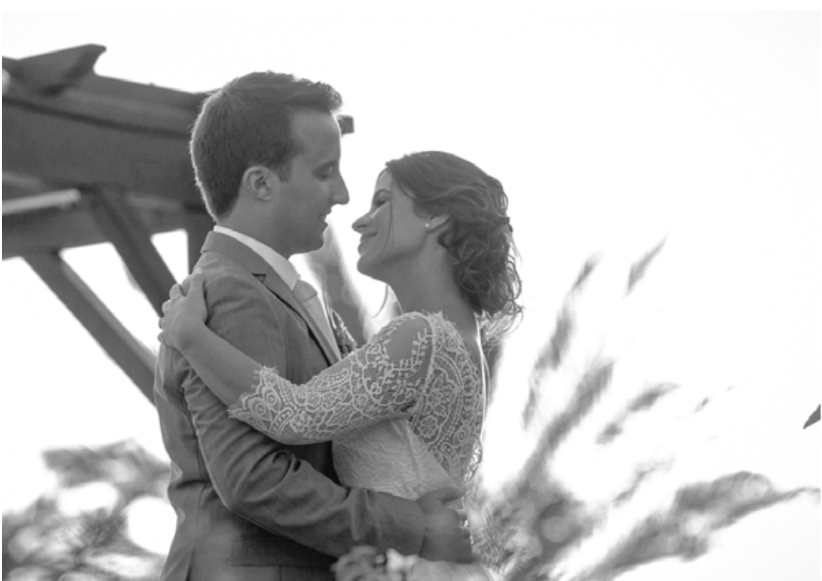
Pestana Grand