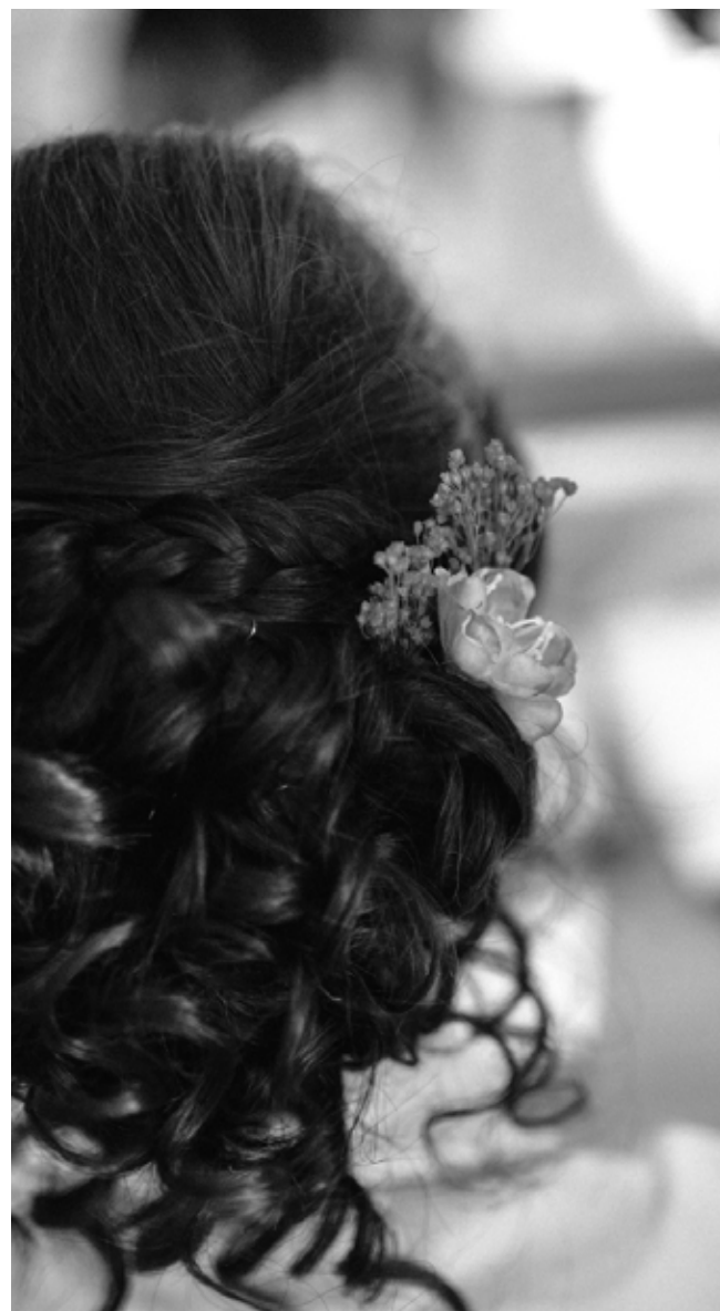
Cabeleireiro parceiro / Partner hairdresser By Jessy