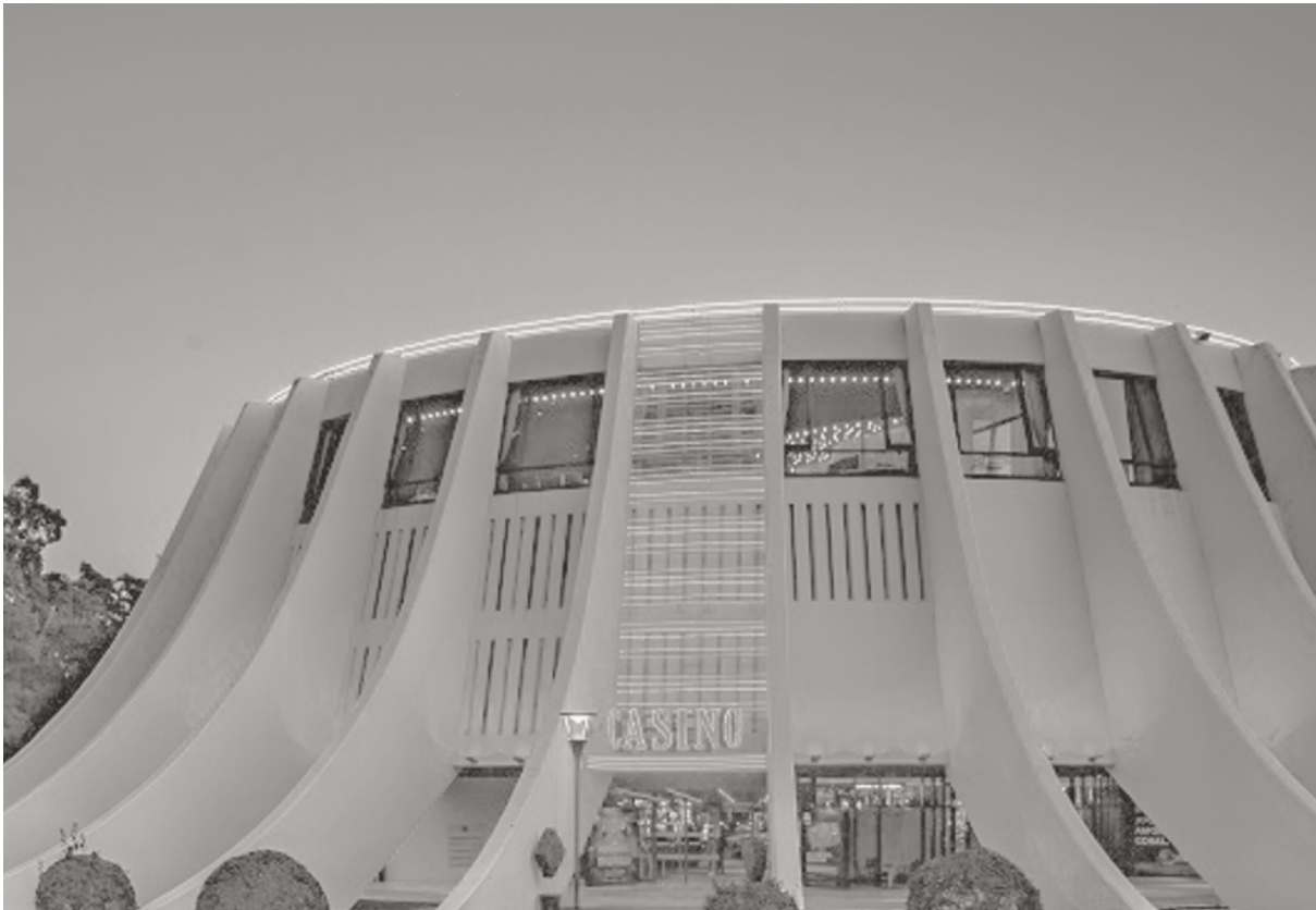
Casino da Madeira