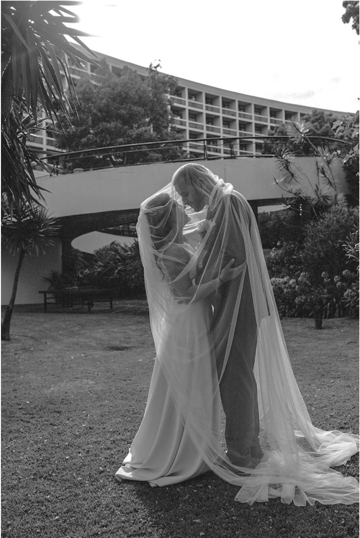
Pestana Casino Park