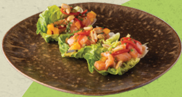
Tártaro de Salmão