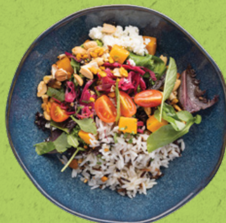
Wild Wild Rice

Adicione uma proteína (65 grms.) Tofu em tempura | Frango de forno | Salmão braseado | Tataki de atum | Rosbife de novilho